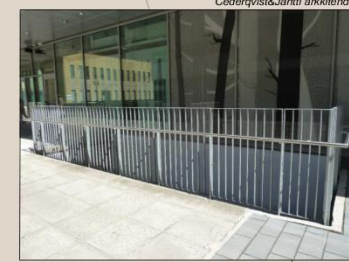
Kaupungintaloo ympäriävä kaidemalli. Muotoitu teräslatta, RAL 9006. Käsihohto: Harjattu RST-putki.

-3x16A (lisäksi kaikissa valopylväissä 1x16A pistorasiat)