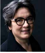
Lilli Paasikivi, mezzosopraano, puheenjohtaja