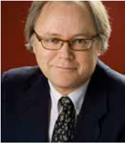
Ilmo Ranta, pianotaiteilija