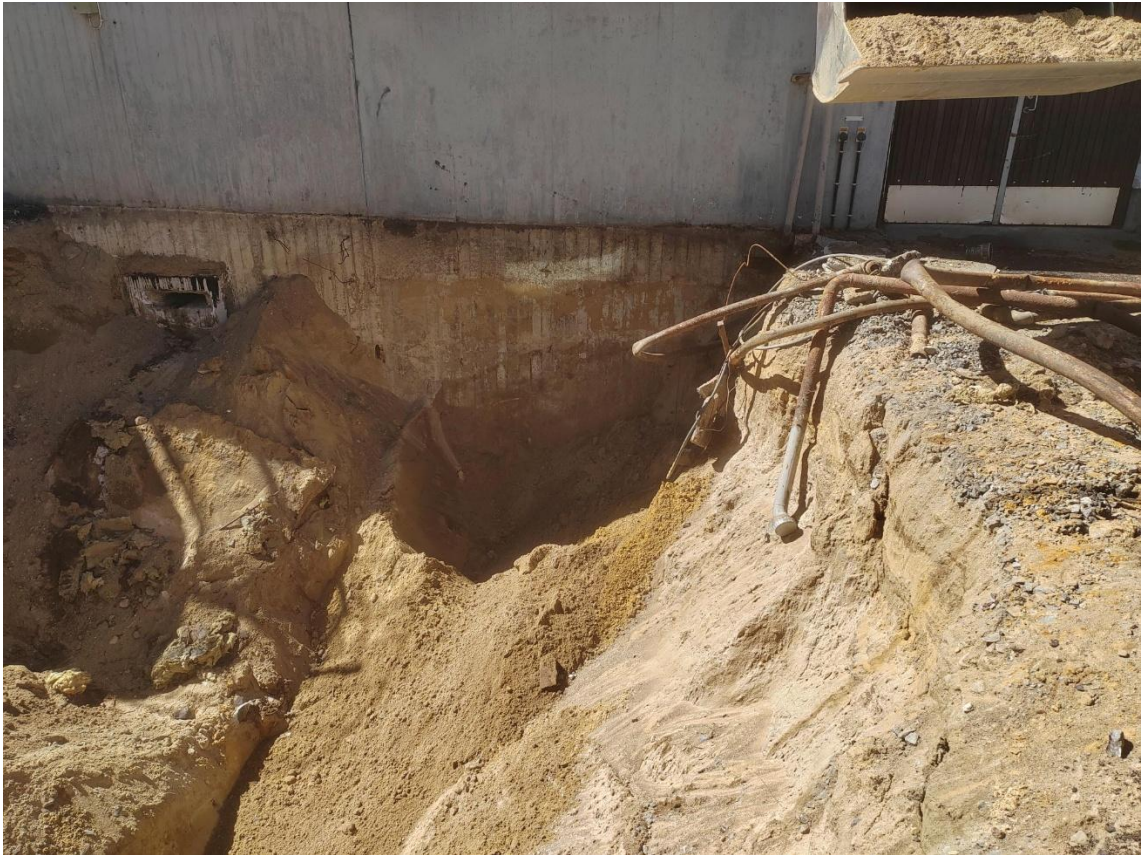
Kuva 3. Täyttöputken kohdalta otettiin kaivinkoneen kauhalla näyte V4.