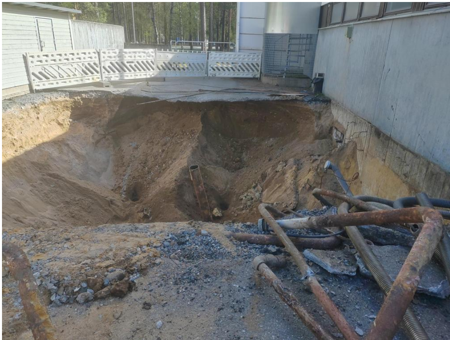
Kuva 2. Säiliökaivanto säiliöiden poistamisen jälkeen 07.05. Kuva otettu pysäköintialueen puolelta Kaivannon pohjoispuolelta. Oikealla lämpölaitos ja vasemmalla jätekatos. Kaivannossa vasemmalla erottuvasta kuopasta otettiin lapiolla näyte V1 ja oikeanpuoleisesta kuopasta näyte V2. Näyte V3 otettiin kaivannon keskiosan pohjasta ja näyte V4 kuvassa oikealla olevan täyttöputken kohdalta.