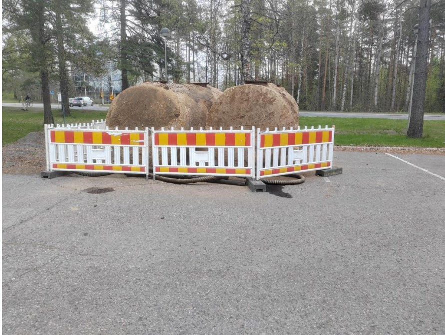
Kuva 1. Kaivannosta nostetut säiliöt sijoitettuna lämpökeskuksen lähelle sairaalan pysäköintialueen reunaan.