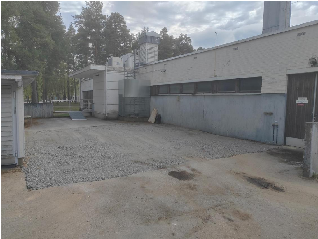
Kuva 4. Kaivanto täytettynä 12.05. Kaivannosta tehtyä tutkimusta täydennettiin kairaamalla täytetyn kaivannon eteläreunaan näytepiste P1, täyttöpäikän lähelle piste P2 ja lämpölaitossiiven pohjoisseinustalle piste P3 (ei näy kuvassa). Päällysteessä näkyvät tummat tahrat ovat säiliöitä tyhjennettäessä roiskunutta öljyä. Tutkimuksissa ei todettu maaperän pilaantuneisuutta.