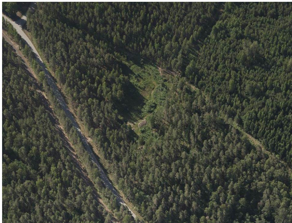
Kuva 2 Viistoilmakuva suunnittelualueelta kuvattuna luoteesta. Kuvassa vasemmalla näkyy Tiurunientie. Kuvassa näkyy myös kaksi sähkölinjaa, jotka yhdistyvät suunnittelualueen eteläpuolella.

Asemakaavan rinnalla laaditaan alueelle osayleiskaavan muutos. Lämpölaitoksen toteuttaminen edellyttää lisäksi ympäristönsuojelulain mukaista ympäristölupaa, josta päätetään erikseen ympäristölupamenettelyssä.