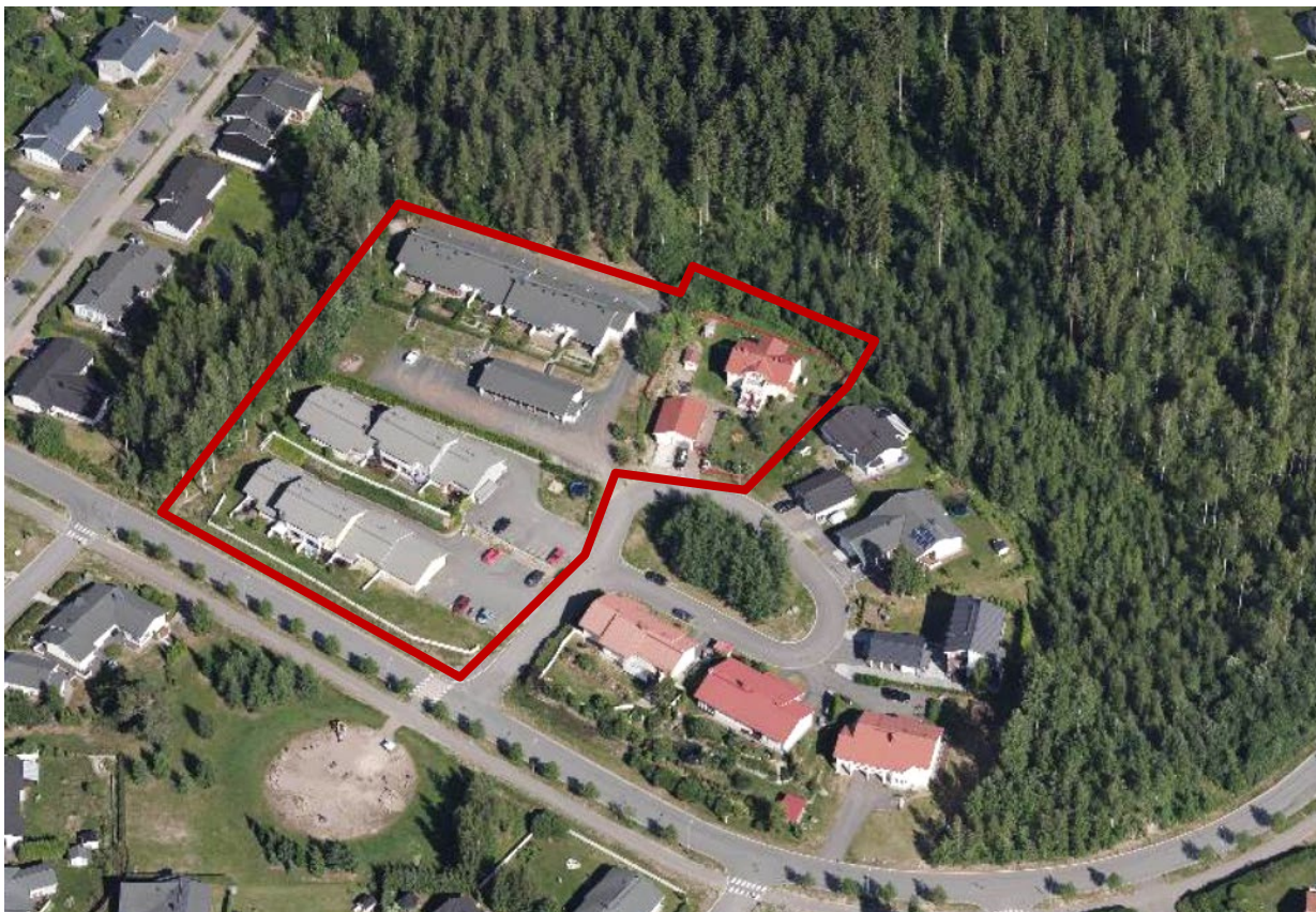
Kuva 2. Viistoilmakuva alueesta. Suunnittelualue on rajattu punaisella.